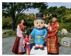
体験ブースイメージ